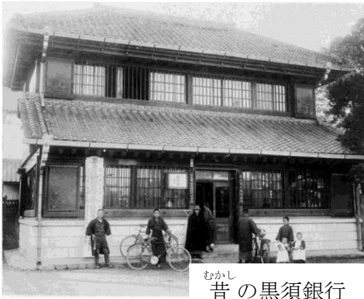
むかし 昔の黒須銀行