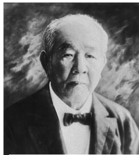
しぶさわ えいいち 渋沢 栄一