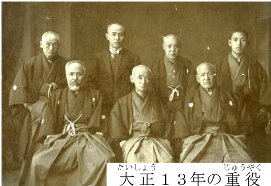
たいしやう 大正13年の重役