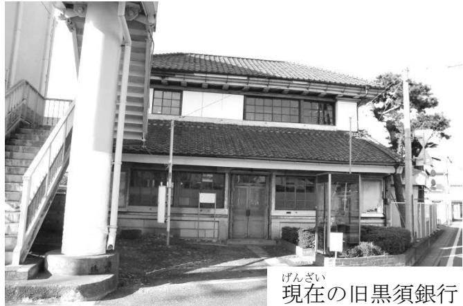
げんざい 現在の旧黒須銀行